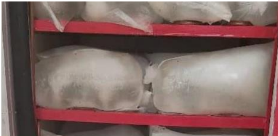
Blocs de glace de 5 kg pour 250 NGN