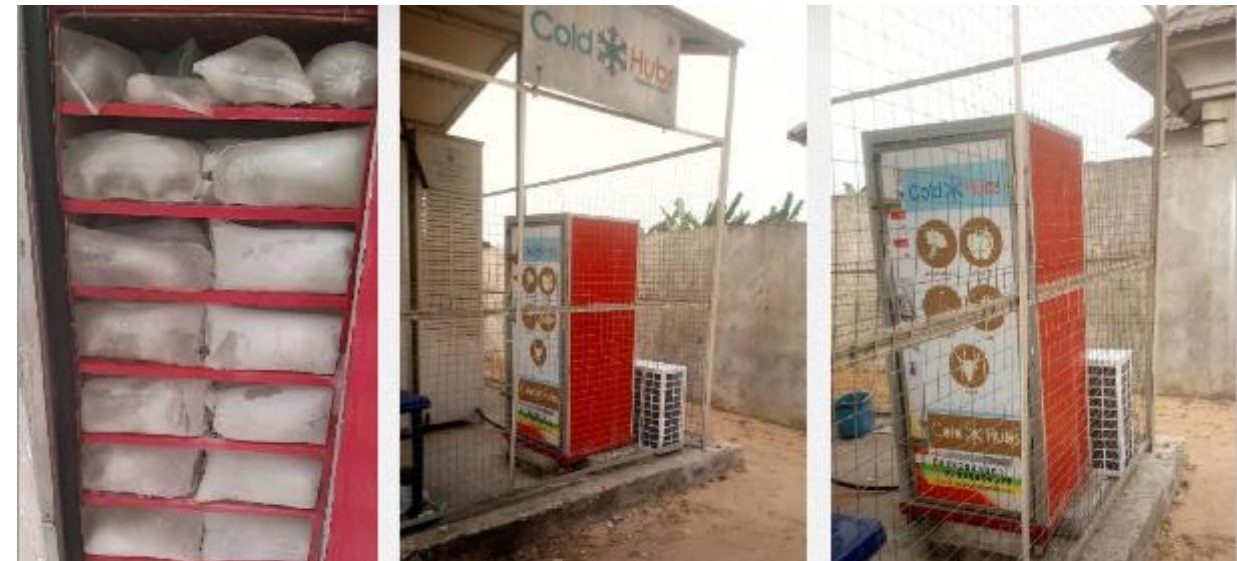
Blocs de glace créés par l'énergie solaire pour conserver les boissons, vaccins, etc