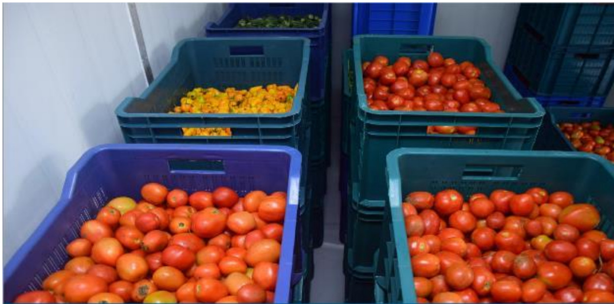
Etend la durée de conservation des produits périssables de 2 à 21 jours.