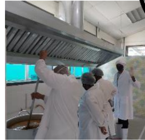
Équipe Maungo Craft

LLB en droit, LLM en droit de la propriété intellectuelle. Pilote la recherche et le développement. Secrétaire de l'Association des produits naturels du Botswana (Natural Products Association of Botswana (NPAB)) Agro - transformation pendant 4 ans