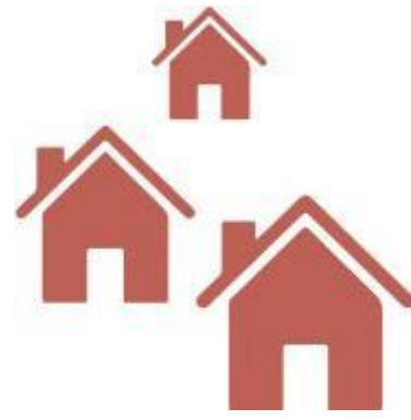
Communauté Maisons Points de vente au détail Restaurant