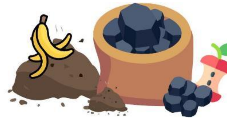
Génération de déchets organiques