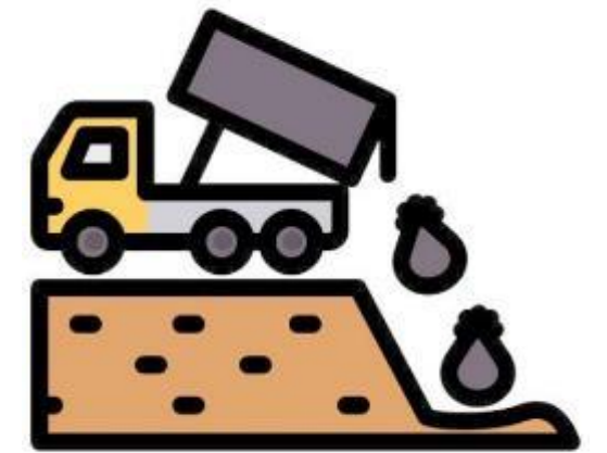
Fin Décharge Valeur perdue