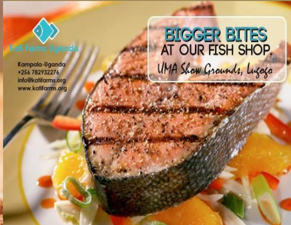
Alestes baremoze (Angara) casse-croûte ; NOUVEAU