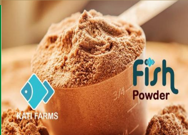
Poudre de poisson comestible ; NOUVEAU