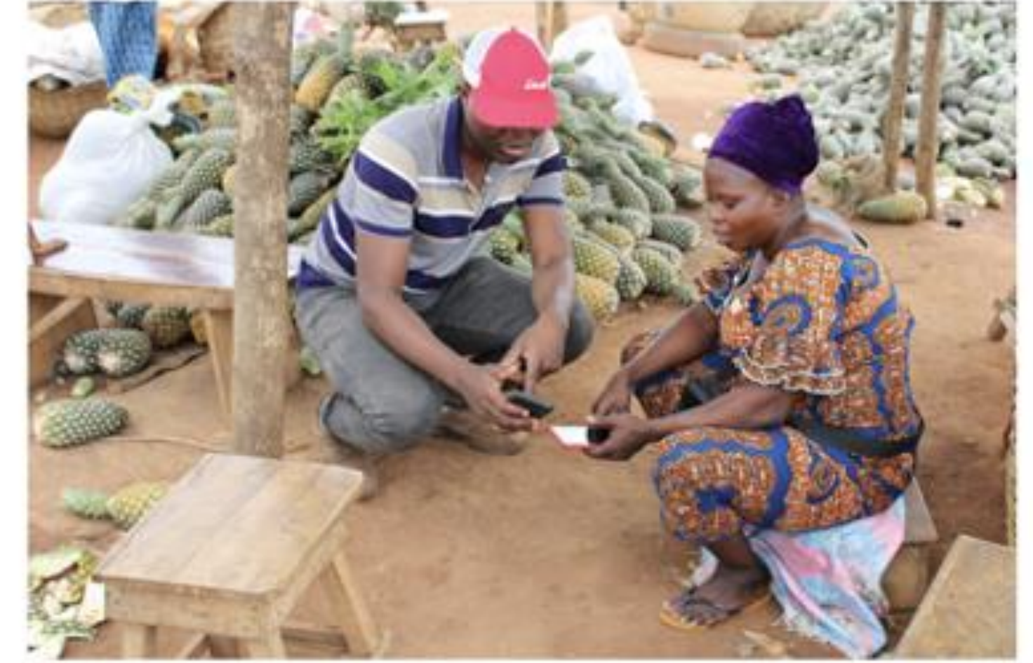
Meeting the merchants