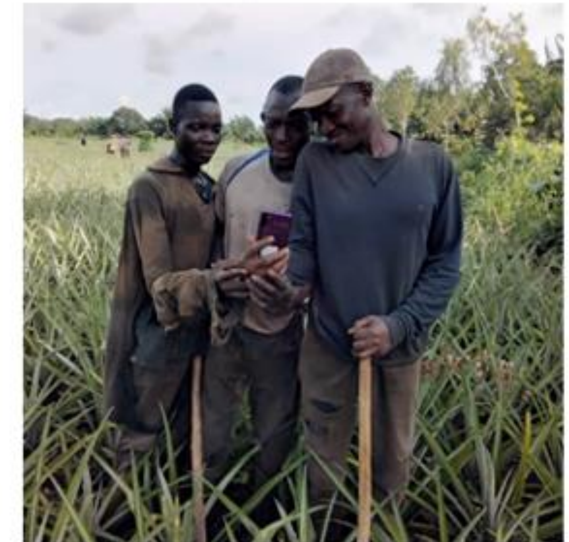
To the mastery of e-pineA by Tori producers