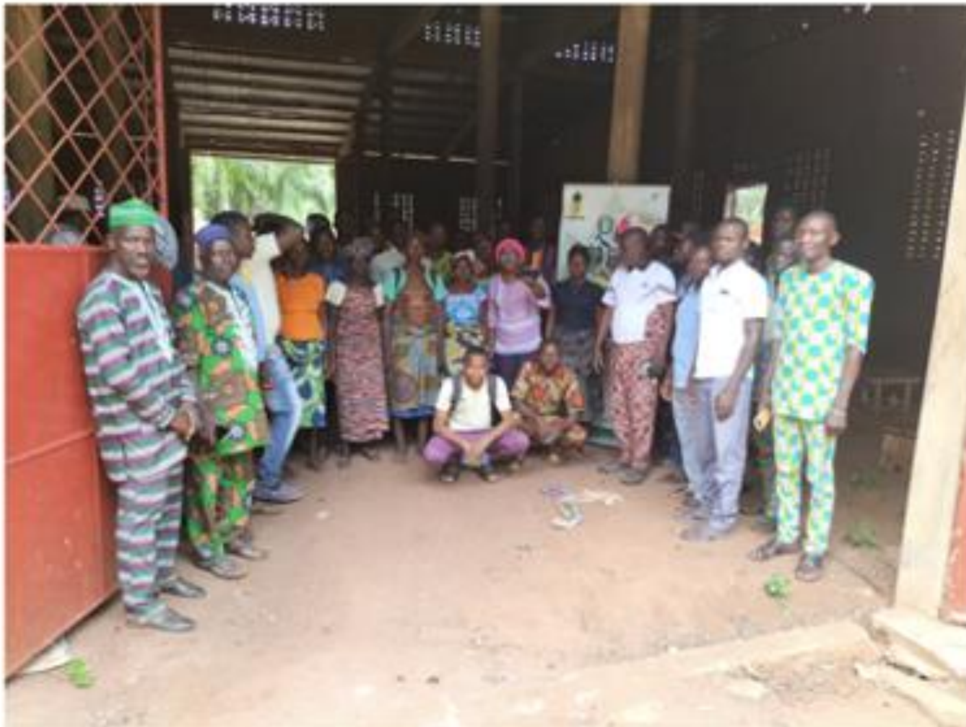
Sensitization of producers in Zè Aifa