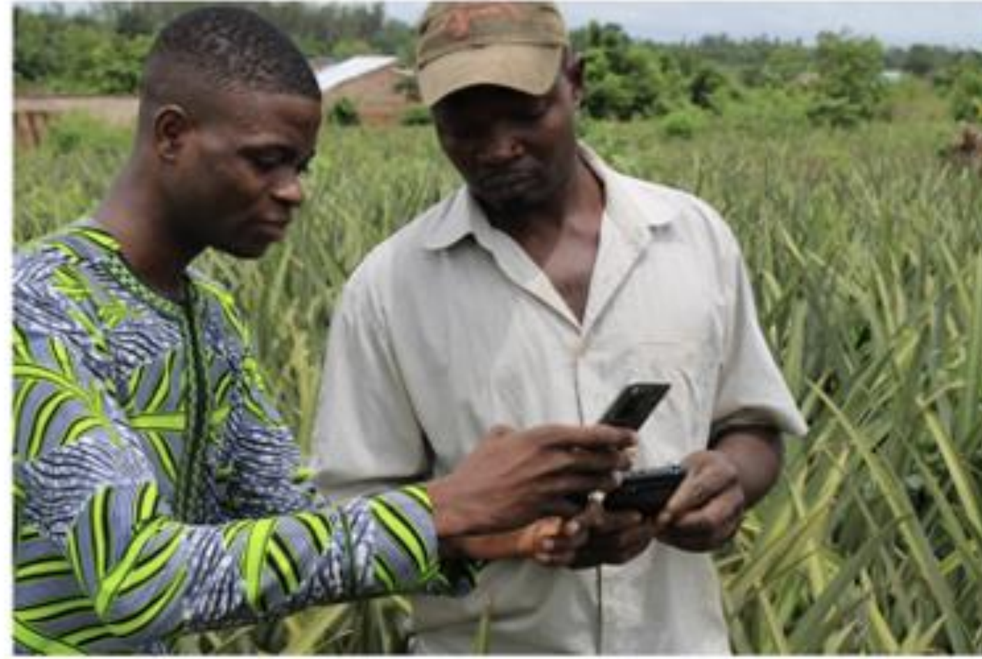
Training and field registration at Zè Tango