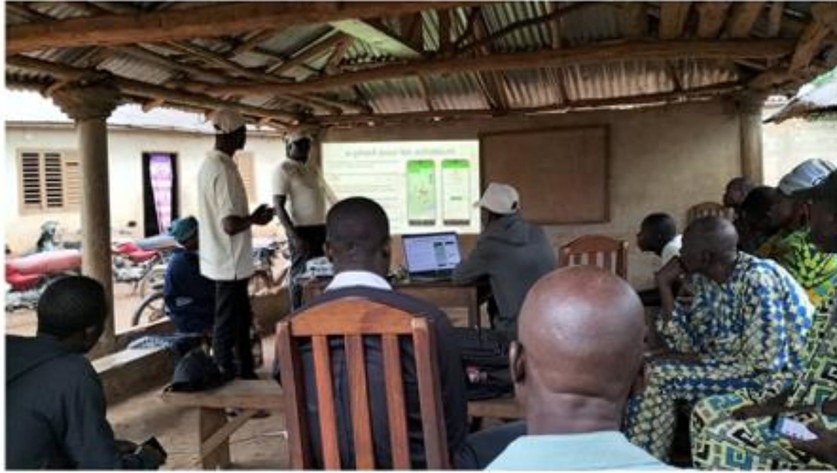
Sensitization of the actors in Zè center