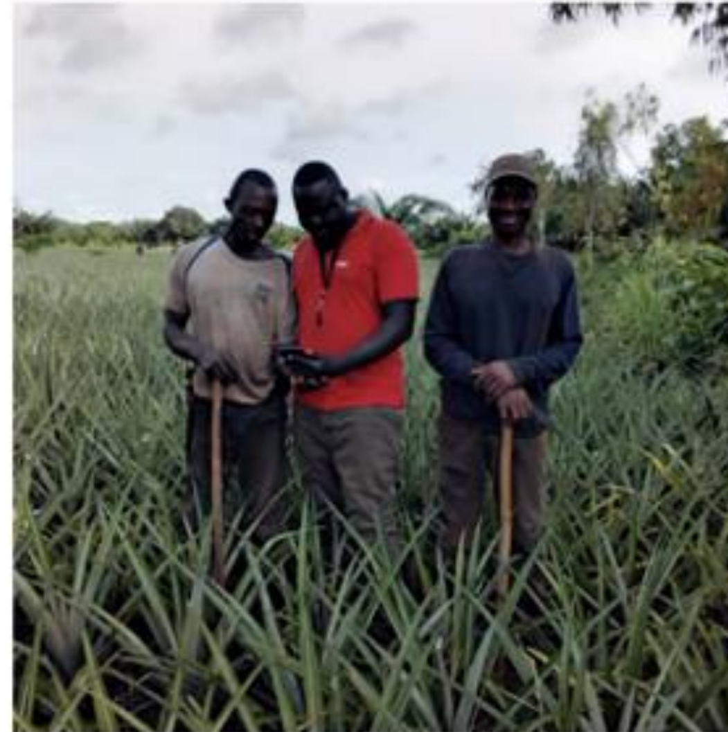
Training and registration of fields in Tori