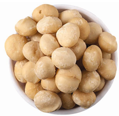
Noix de macadamia transformées