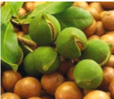
Noix de macadamia brutes avec leur coque