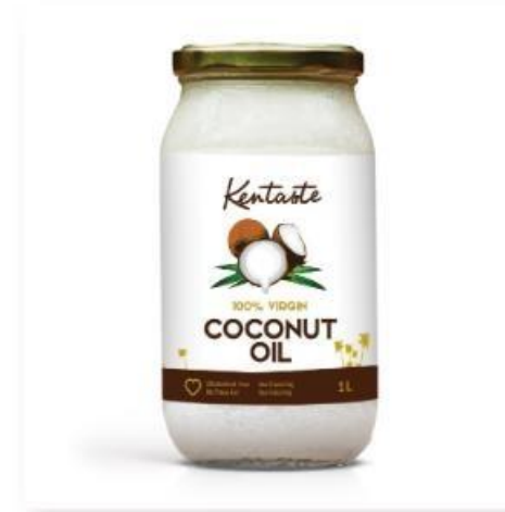
Huile de coco