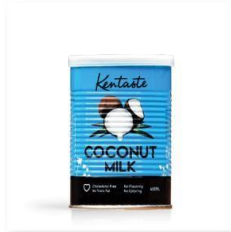
Lait de coco