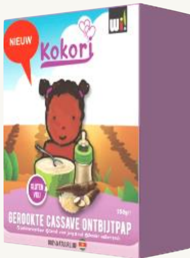
Gachas enriquecidas con mandioca