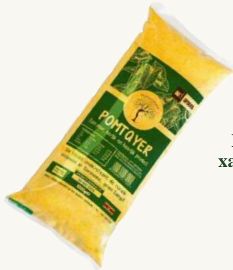
Raíz de hoja de flecha xanthosoma sagittifolium