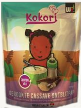
Preparación del desayuno mandioca fûmé