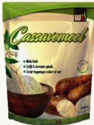
Harina de mandioca