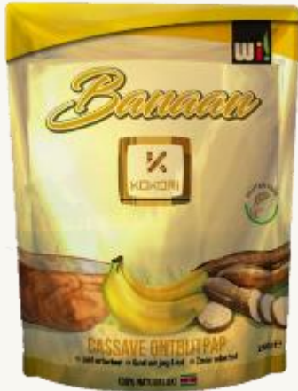
Mezcla de mandioca y plátano para el desayuno