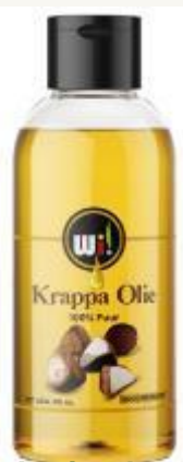
Aceite de cangrejo carapa guianensis