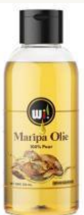
Aceite de maripa Atalea maripa