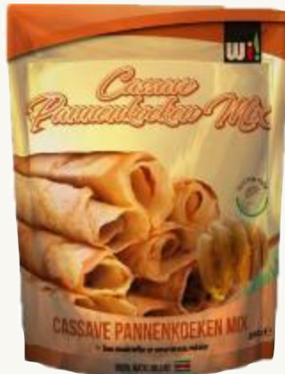
Preparación de la masa para tortitas de mandioca