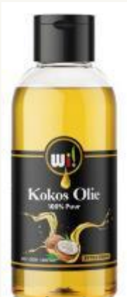
Aceite de coco virgen extra