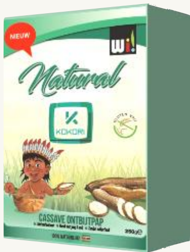
Gachas enriquecidas con mandioca