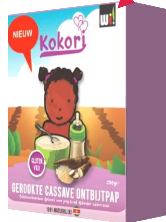
Nueva fórmula enriquecida 2023