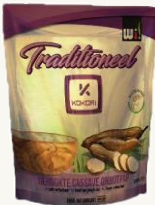
Preparación del desayuno a base de mandioca