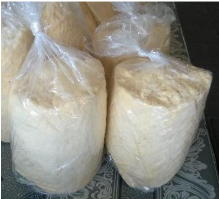
Originalmente en el mercado