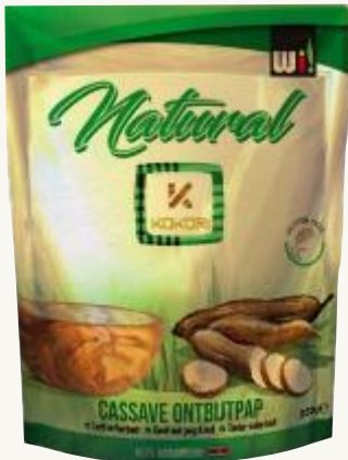
Preparación del desayuno a base de mandioca