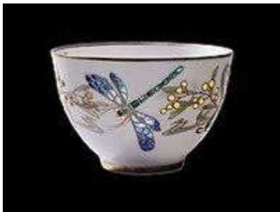
Porcelaine de Limoges