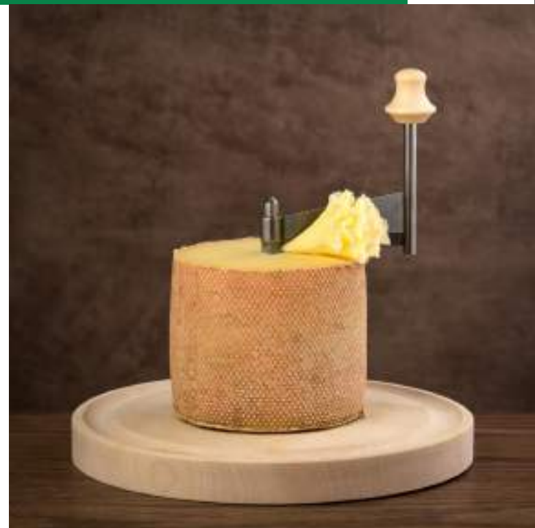
Machine de tête de moine, brevetée