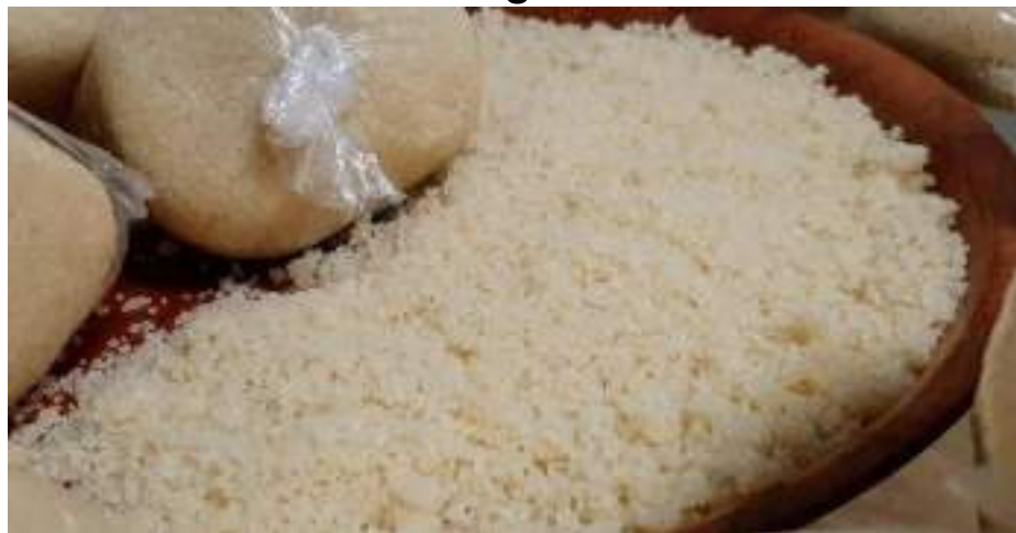
Attiéké de Côte d'Ivoire