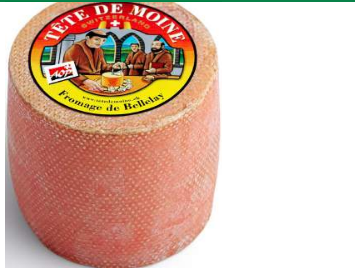
IGP Tête de moine