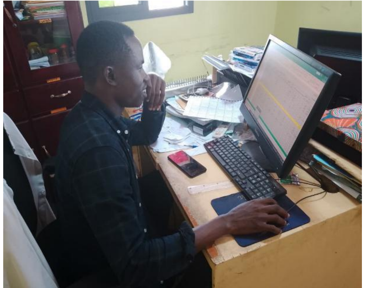
Hoy: e-Impot / e-cnps