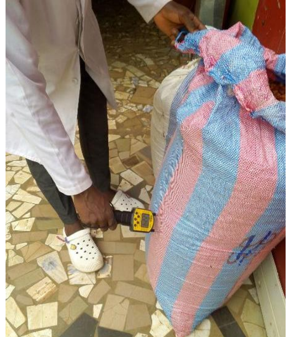
Hoy: al tacto Medidor de humedad