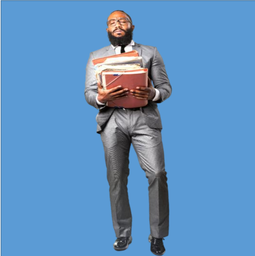
Antes: en persona