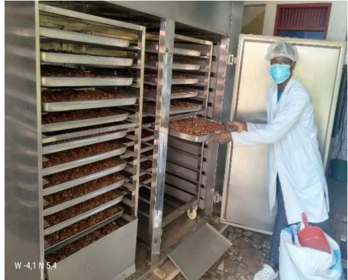
Hoy: secado eléctrico