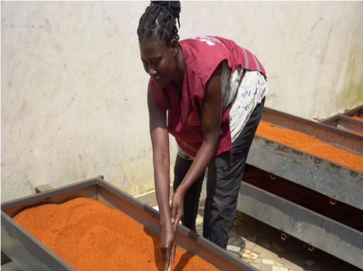
Antes: secado mecánico