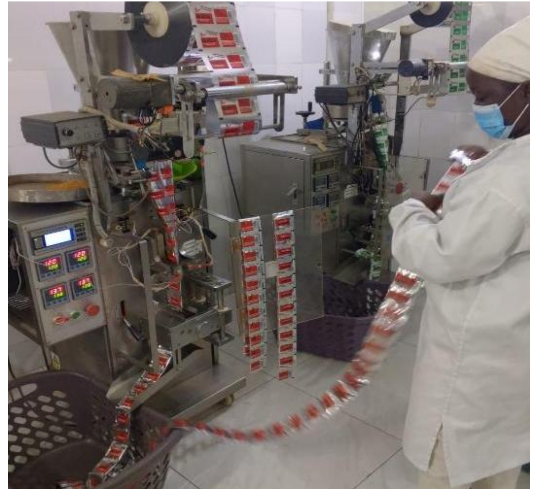
Hoy: e-Impot / e-cnps