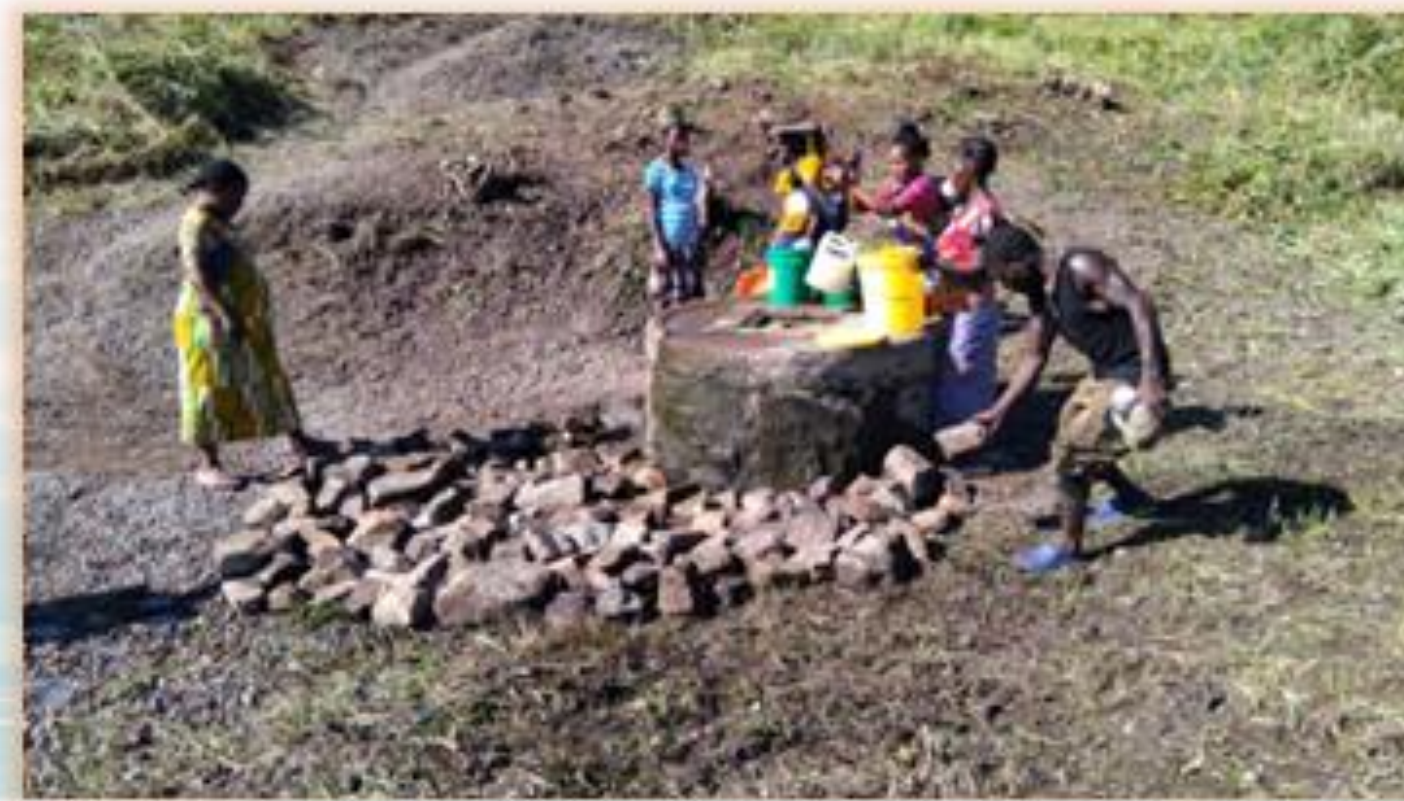
Los miembros del Club Dimitra organizaron una exitosa limpieza del pozo y sus alrededores.