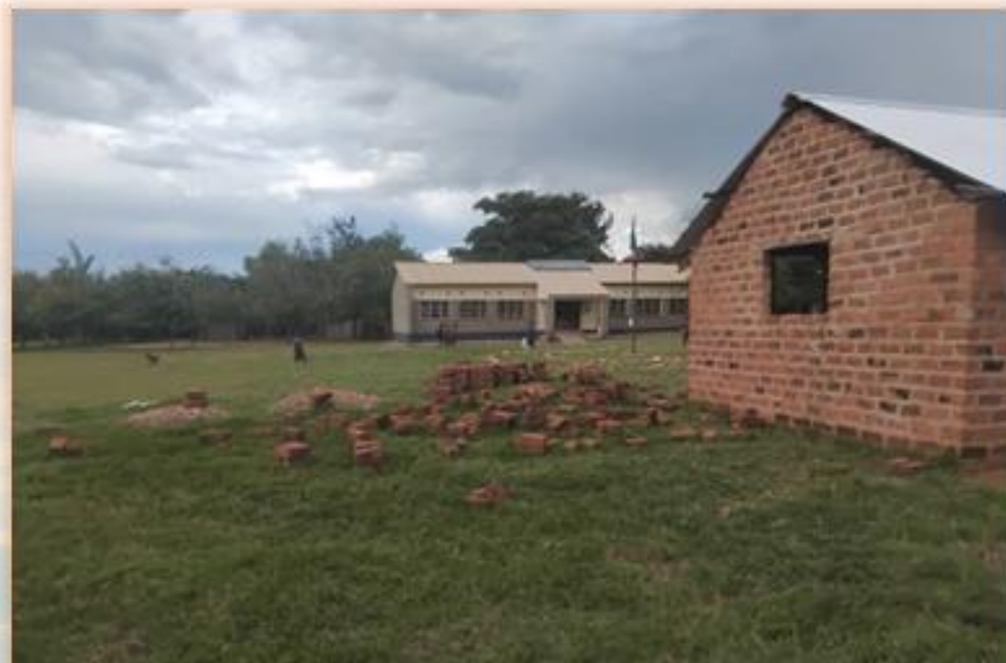
Los miembros del Club Dimitra aportaron ladrillos y se encargaron del transporte de materiales al lugar para la construcción de una guardería comunitaria.