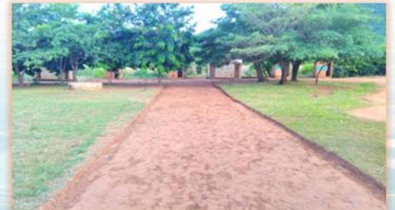
El Club Dimitra movilizó a los miembros de la comunidad para mejorar el entorno escolar mediante el trabajo voluntario y la puesta en común de recursos locales.